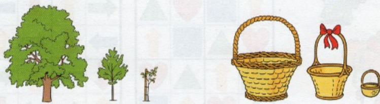
strom - stromek - stromeček